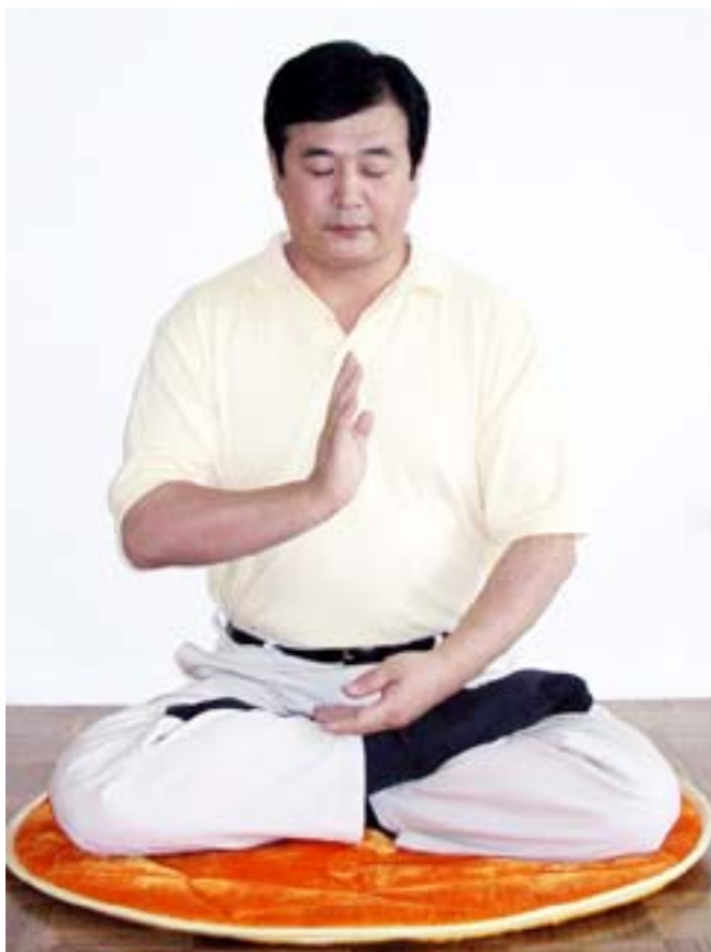
Tenendo un palmo eretto