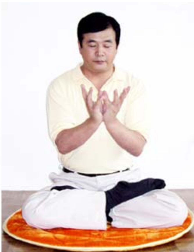
La posizione della mano di loto