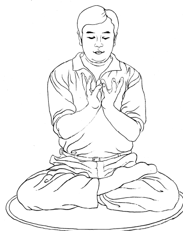
La position des mains en lotus

Fa djeun'g t'hièn coun sié eu t'huan mié