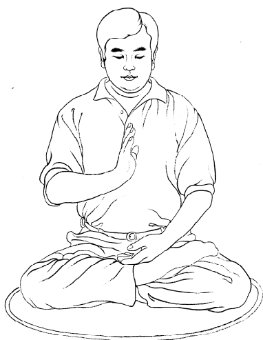
Tenir une main dressée